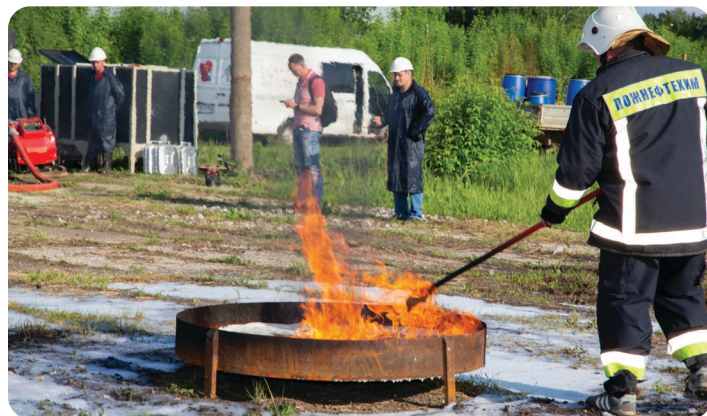
Огневые испытания на полигоне (практическое занятие для участников курсов ГК «Пожнефтехим»)