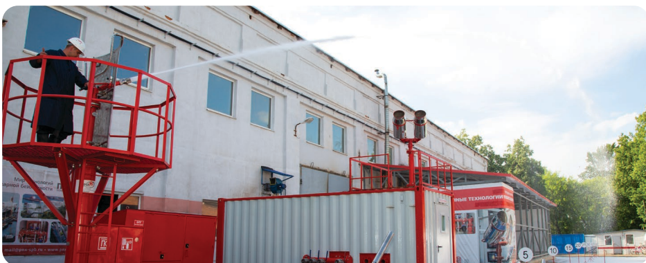
Фото с Курсов повышения квалификации: практические занятия, демонстрации, зачет, удостоверения