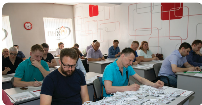
Группа в учебном классе ГК «Пожнефтехим»: КПК-2018 (слева) и КПК-2019 (справа).